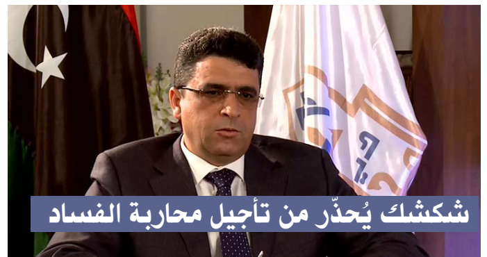
شكشك يُحذّر من تأجيل محاربة الفساد

أدان النائب الأول لرئيس مجلس النواب فوزي النويري "بعض التصريحات للدبلوماسيين في الشأن الليبي التي من شأنها أن تقوض أي تقارب بين الليبيين وتهدد الأمن القومي للبلاد". وقال النويري في بيان له، إن هذه التصريحات الصادرة عن دبلوماسيين سواء أكانوا مبعوثين خاصين أو سفراء أو حتى رؤساء لبعض الدول تأتي في وقت تقترب فيه البلاد من تسوية وطنية (ليبية - ليبية)، واعتبرها تدخلات سافرة في الشأن الليبي؛ يمنعها القانون الوطني والقانون الدولي.