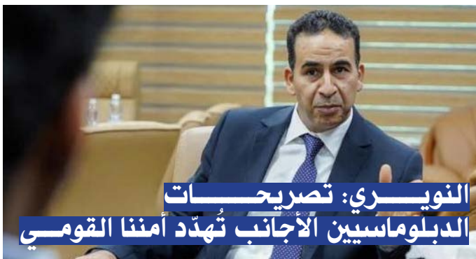
النويري: تصريحات الدبلوماسيين الأجانب تهدد أمننا القومي