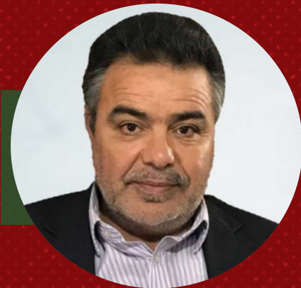
بقلم الكاتب | عبدالله الكبير