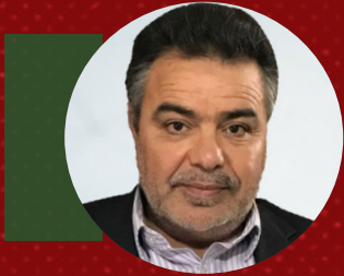
بقلم الكاتب | عبدالله الكبير