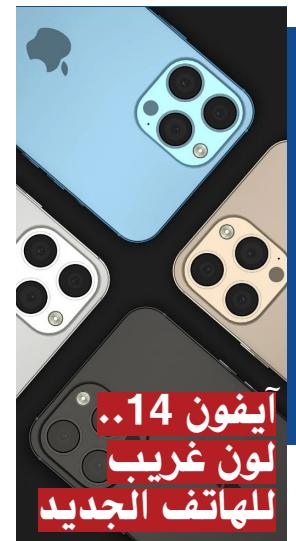
آيفون 14.. لون غريب للهاتف الجديد

ولا يوجد تفاصيل حتى الآن عن درجة البنفسجي التي سيتم استخدامها للهاتف، حيث قد تكون فاتحة، أو غامقة قريبة من الأزرق.